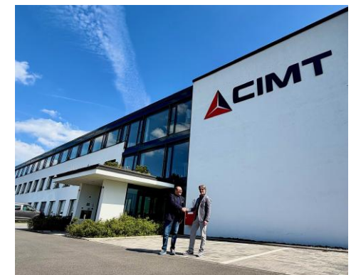
DKW besucht die Firma CIMT